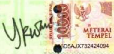
IRWANDI WILSYAM KEPALA CABANG